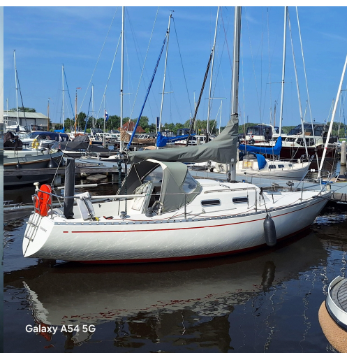
Galaxy A54 5G