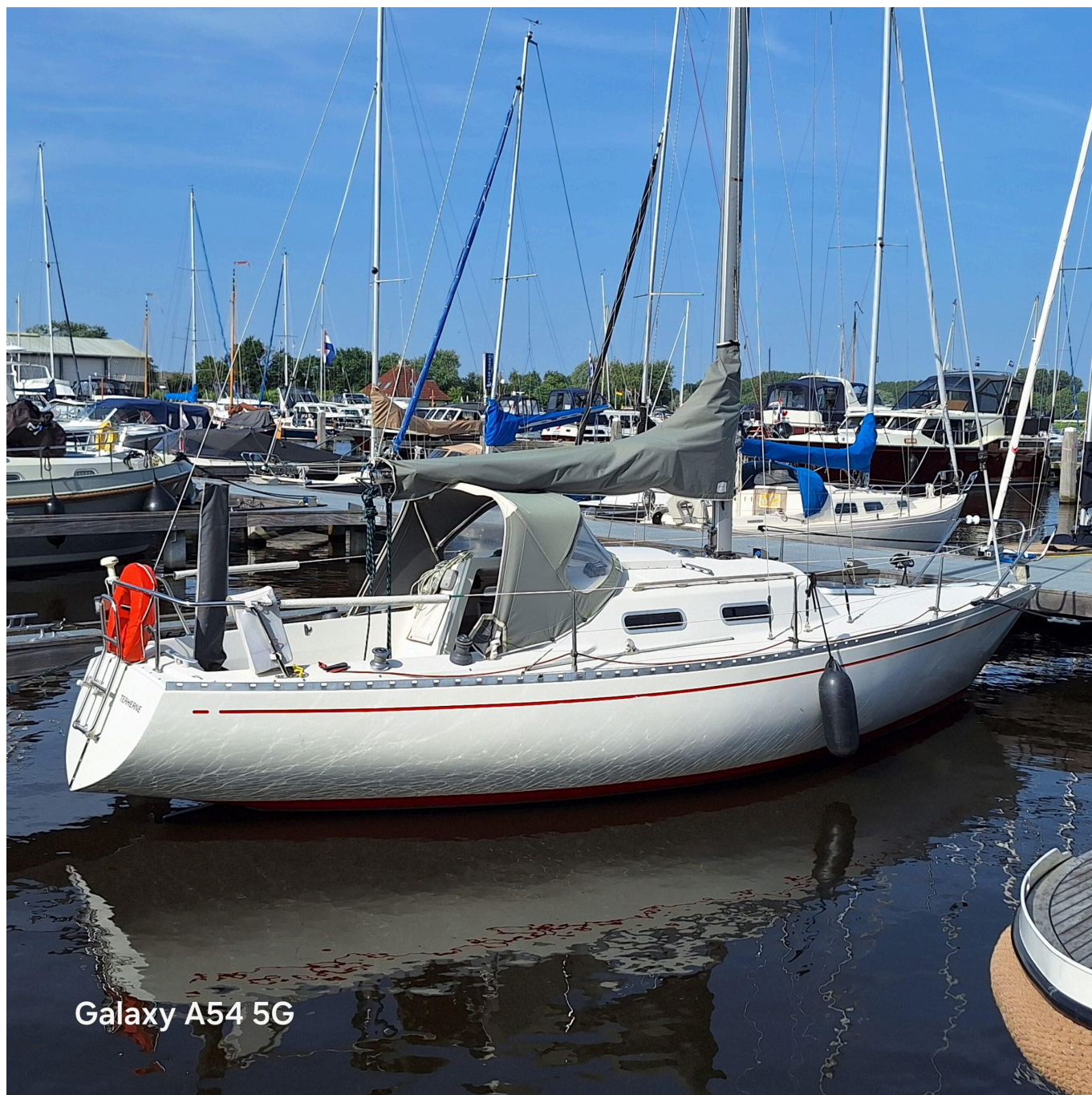
Galaxy A54 5G

Na 7 geweldige zeiljaren bieden we onze Zweedse Albin Accent 26 (Peter Norlin ontwerp)aan.