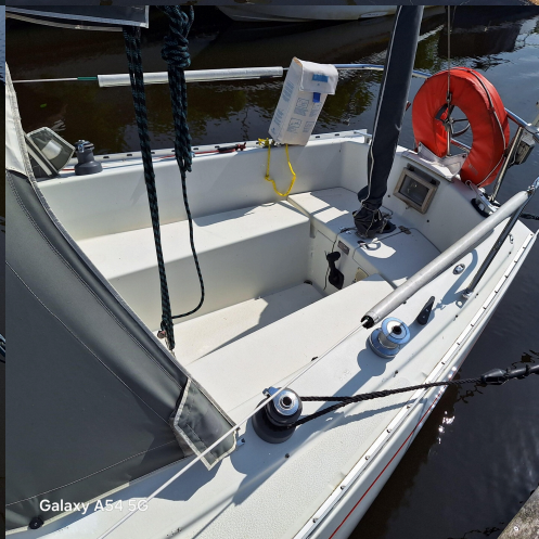
Galaxy A54 5G