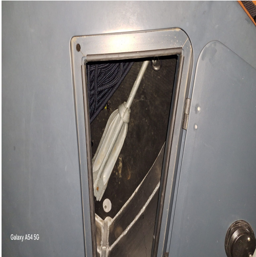
Galaxy A54 5G