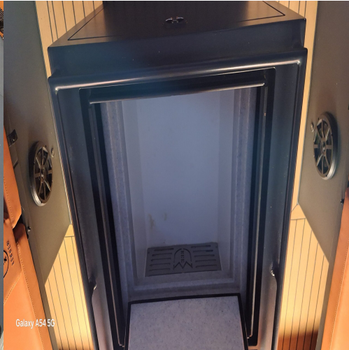
Galaxy A54 5G