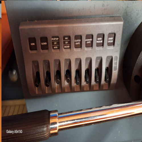
Galaxy A54 5G