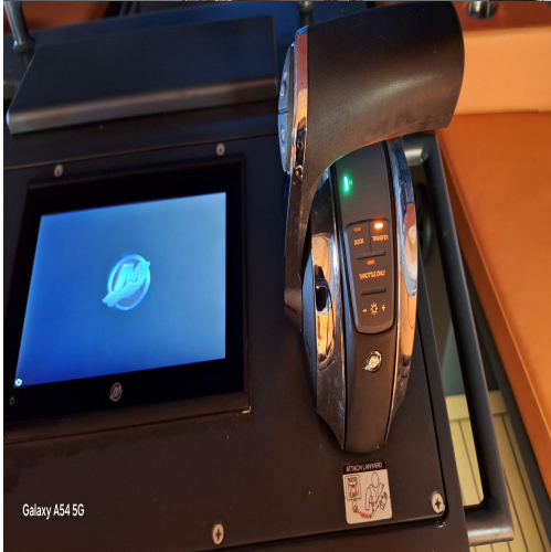
Galaxy A54 5G