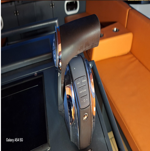
Galaxy A54 5G