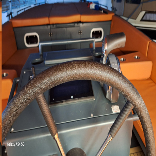
Galaxy A54 5G